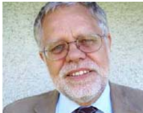
Torsten Frieberg Presidente del Consejo Nacional de Educación de Personas Adultas, Suecia

Durante estos tres días también tendremos la oportunidad única de entablar un diálogo creativo entre los actores de la experiencia de los países nórdicos y todos los demás participantes que, de diferentes maneras, se esfuerzan por promover el derecho al aprendizaje de mujeres y hombres en sus respectivas regiones. Sí, otro mundo es posible, pero no sin la participación creativa de todos/as y cada uno/a de los ciudadanos/as. Esta asamblea será un momento intenso de aprendizaje y solidaridad, que podría convertirse en un punto de inflexión en el trabajo de incidencia local y global necesario para construir "un mundo en el que valga la pena vivir".