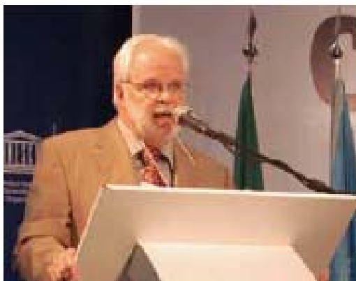
Paul Bélanger Presidente del ICAE, Canadá

Les damos una cálida bienvenida a todos/as quienes vienen de los diferentes continentes a la VIII Asamblea Mundial del ICAE. Bienvenidos/as a nuestra Asociación Europea, la EAEA, que ha tomado la gran iniciativa de vincular la asamblea general con la Asamblea Mundial del ICAE.